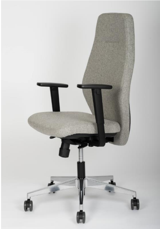
Art. 8137 - 1E