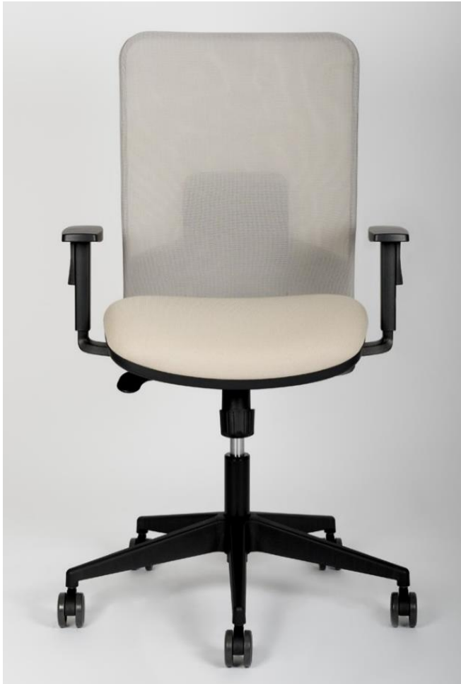
Art. 2937 - MESH 3