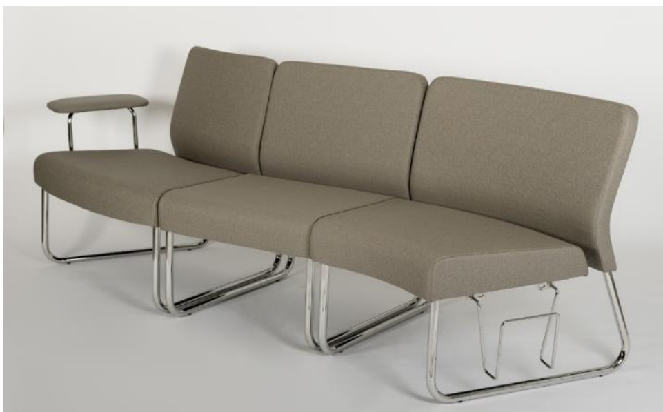
Art. 9900 – 9700 – 9800 BR - PR