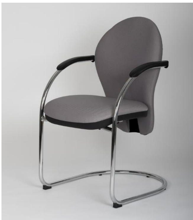
Art. 7581 - TC