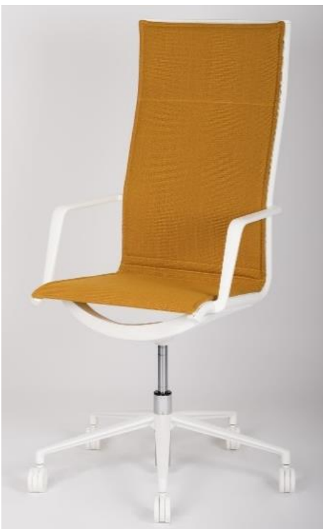
Art. 1453 – 11 – RUO