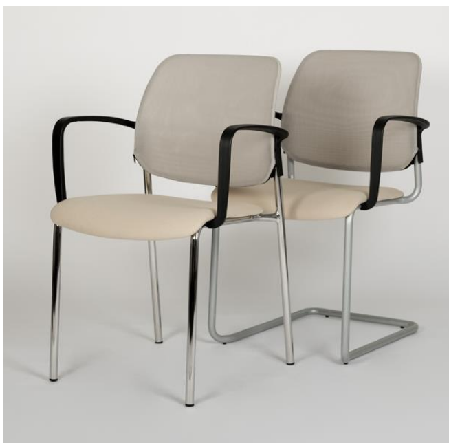
Art. 2923 - MESH 3