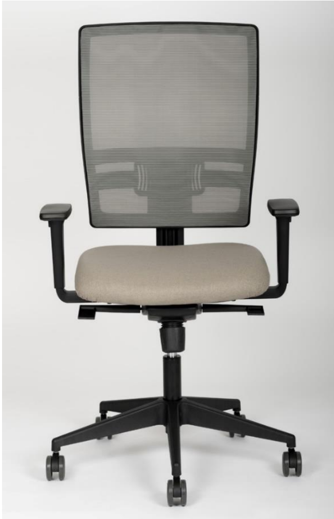
Art. 6137 - MESH 1