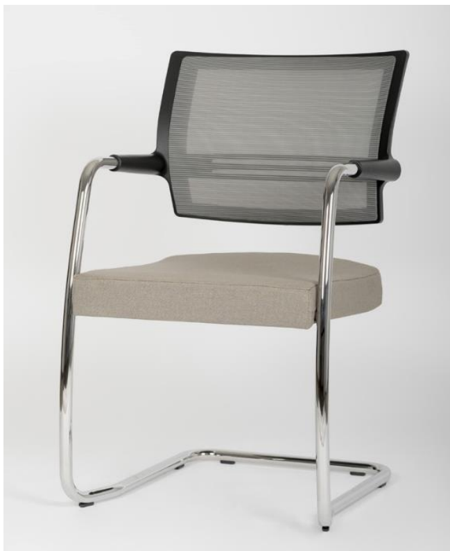
Art. 6181 - MESH 1