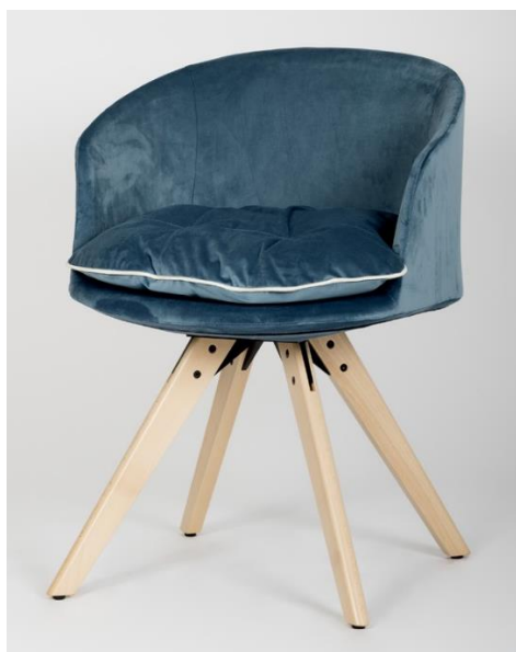
Art. 5124 WD

Seduta monoscocca collettività e visitatore. Struttura in poliuretano schiumato con inserto in metallo, schienale alto o basso e sedile rivestiti, braccioli integrati.